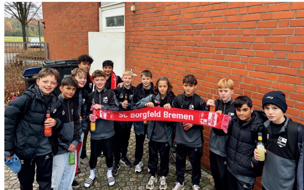
Die Jungs haben nach dem letzten Pflichtspiel mit einer Limo für die starke Saison gefeiert.