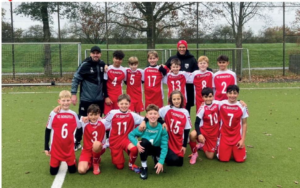
Foto kurz nach unserem letzten Pflichtspiel. Ab hier hieß es abwarten, bis das letzte Spiel der Runde gespielt wurde.