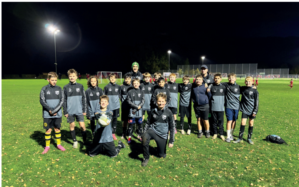
Beim Wind und Wetter die D4 ist hochmotiviert.